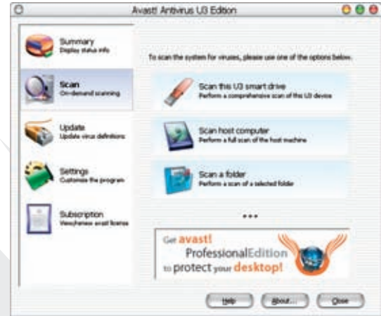
avast! antivirus U3 program 屏幕捕捉(扫描)